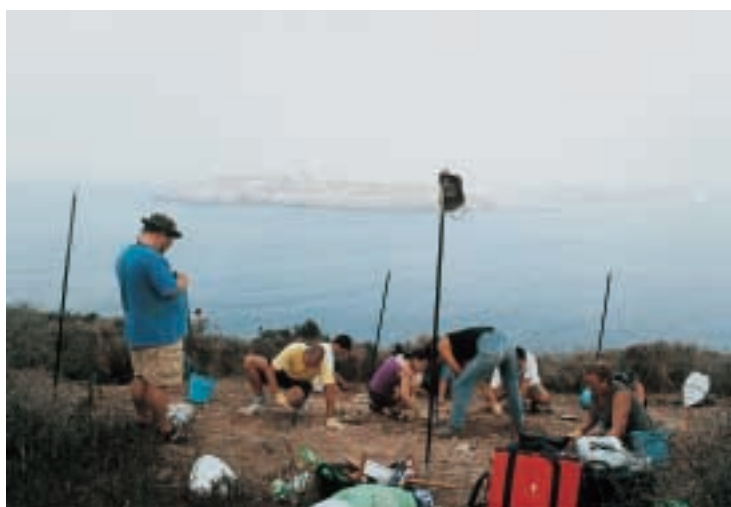
▲ Zona de excavaciones.

Las Chafarinas son un archipiélago de tres islas bajo soberanía española desde 1848, que comprenden una superficie de 0,75 kilómetros cuadrados. Está situado a 27 millas de Melilla, frente a la costa marroquí y muy cerca de Argelia. Reciben el nombre de Isabel II, Rey y Congreso, siendo ésta última, llamada así en honor del Congreso de los Diputados, la que comprende los hallazgos arqueológicos más espectaculares. La gestión de las islas es compartida por el Ministerio de Defensa a través de un destacamento de Regulares y de la Compañía de Mar de la Comandancia General de Melilla y del Ministerio de Medio Ambiente a través del Organismo Autónomo Parques Nacionales, ya que debido a su riqueza biológica, marina y botánica son Refugio Nacional desde 1982, contando por ello con una importante protección que salvaguarda este espacio natural de incalculable valor ambiental, donde habitan varias especies protegidas.