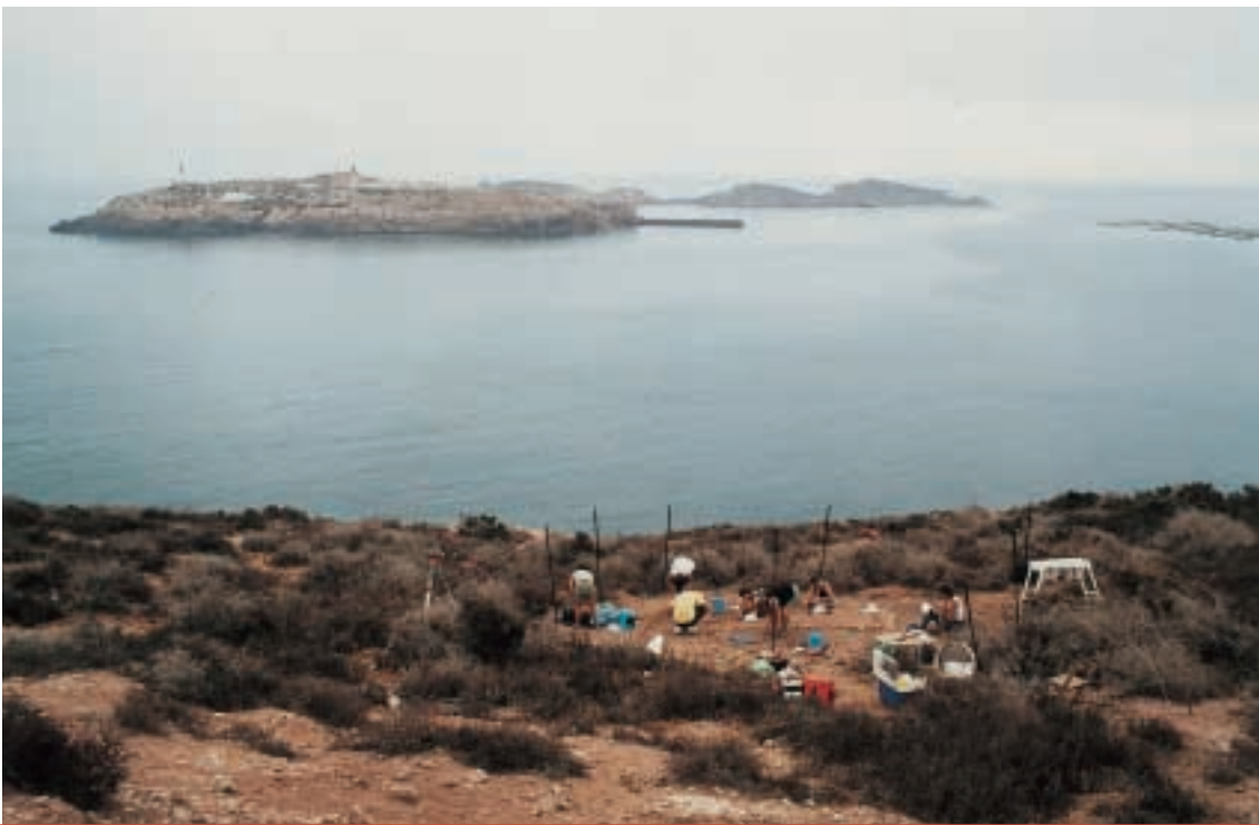
▲ Vista general del área de excavaciones “El Zafrín”, en la isla de Congreso.

determina la gran cantidad de piezas y su estado de conservación. Quizás pudiéramos estar ante un espacio donde estudiar la actividad humana de la época neolítica al completo, pues al norte de la isla se identificaron unos bancales agrícolas que pueden pertenecer a este momento cultural