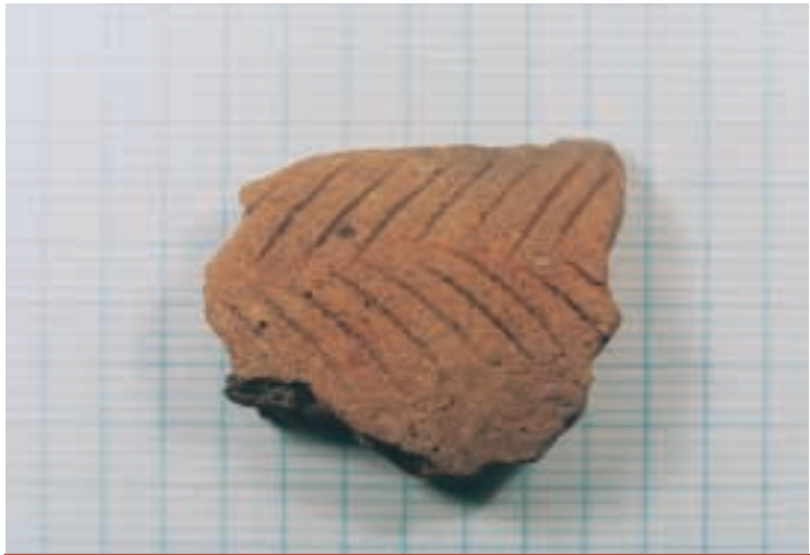
▲ Fragmento de olla globular de arcilla. (Autor: M º José Blanco).

En la Isla del Rey se han realizado varias prospecciones exhaustivas que han dado como fruto el descubrimiento de numerosos materiales en sílex (varios centenares) sin cerámica, cuya tipología se remonta a periodos anteriores al neolítico, en concreto a momentos epipaleolíticos, la denominada